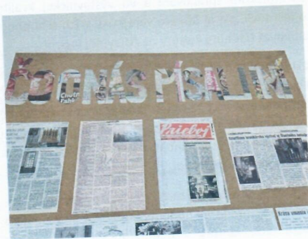
Jubilejná výstava Vitajte, máme otvorené – už 75 rokov (časť výstavy), Múzeu v Bojniciach