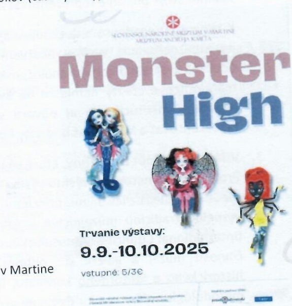
Výstava Monster High , Múzeum Andreja Kmeťa v Martine